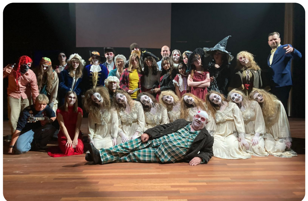
Eigen theaterproductie MDT: Griezelen in vanBeresteyn, Halloween